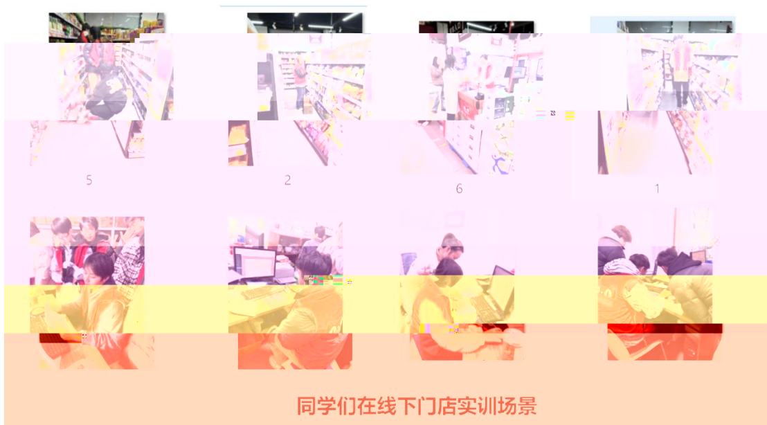
同学们在线下门店实训场景